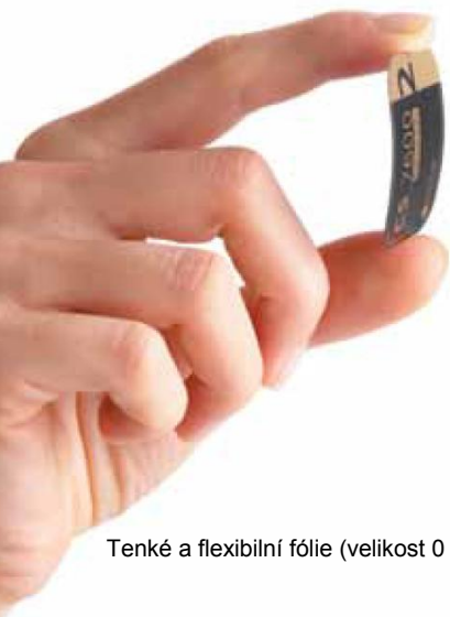
Tenké a flexibilní fólie (velikost 0 až 4).