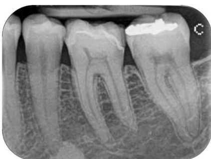
Zobrazení snímků za pouhých pět sekund.